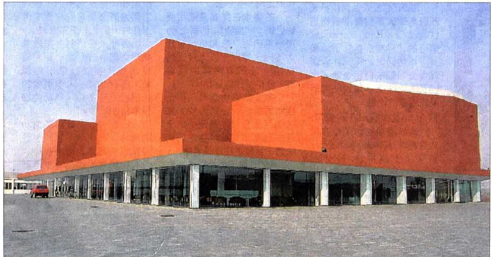
北京的宋庄已经成为中国当代艺术重镇，有大约1500名艺术家在此生活及创作，图为宋庄美术馆。

宋庄是北京以东23公里的小镇，离北京国际机场约十分钟的车程。这里是中国当代艺术重镇，有大约1500名艺术家在此生活及创作，其中享誉国际的为数不少，如方力均、祁志龙、杨少斌和岳敏君等。来自世界各地的艺术家、评论家、策展人和收藏家也定期在此聚集，就当代艺术的最新发展展开讨论、交流与辩论。新当代艺术中心的设想，是要成为一个