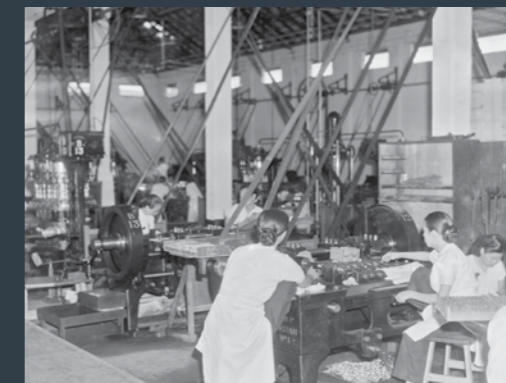
Gambar atas: Kilang Pembungkusan Candu di Bukit Chandu

Banglo ini dibina pada 1930 bersama dengan sekumpulan banglo-banglo lain untuk pekerja kanan British di Kilang Pembungkusan Candu. Walaupun dipengaruhi gaya banglo kolonial hitam-putih yang lain, banglo ini juga memiliki unsur-unsur Art Deco yang tersendiri. Pada 1990-an, kepentingan awam menyebabkan banglo ini dipelihara dan diserahkan kepada Arkib Negara Singapura untuk digunakan sebagai pusat tafsiran Perang Dunia Kedua. Renungan di Bukit Chandu dibuka pada 15 Februari 2002.