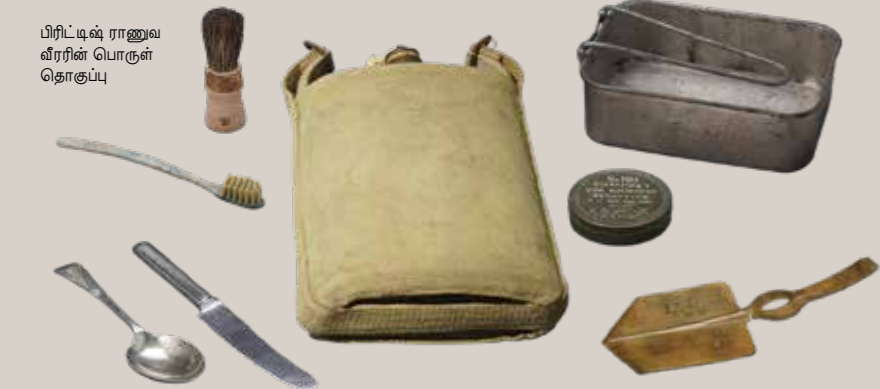
பிரிட்டிஷ் ராணுவ வீரரின் பொருள் தொகுப்பு

சிங்கப்பூர் சரணடைவதற்குள் 100க்கும் மேற்பட்ட மலாய் படைப்பிரிவு வீரர்கள் போரில் மடிந்தனர். அதோடு, சரணடைந்த பிறகு ஜப்பானிய வீரர்கள் உத்தரவிட்டும் சீருடையைக் கழற்ற மறுத்ததால் மேலும் பலர் கொல்லப்பட்டனர். கண்காட்சியின் இப்பகுதி, தாஜட் செத்தியா (Ta'at Setia - மலாய் மொழியில் "விசுவாசத்துடனும் உண்மையுடனும்") எனும் படையின் குறிக்கோளுக்கு இறுதி வரை இலக்கணமாகத் திகழ்ந்த இந்த வீரர்களுக்கு அஞ்சலி செலுத்துகிறது.