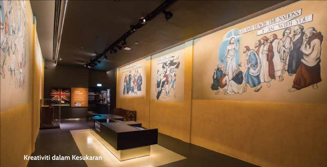
Kreativiti dalam Kesukaran