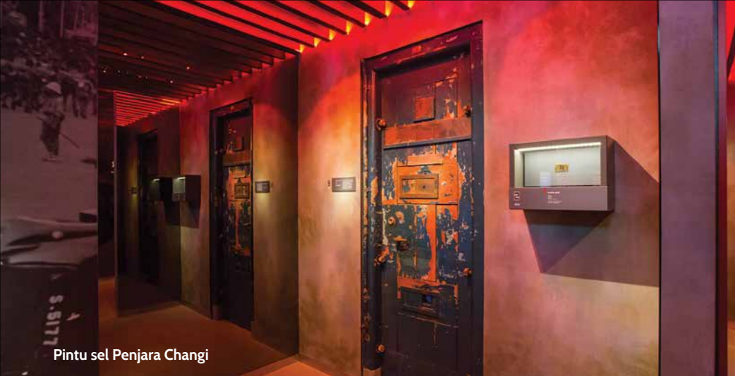
Pintu sel Penjara Changi