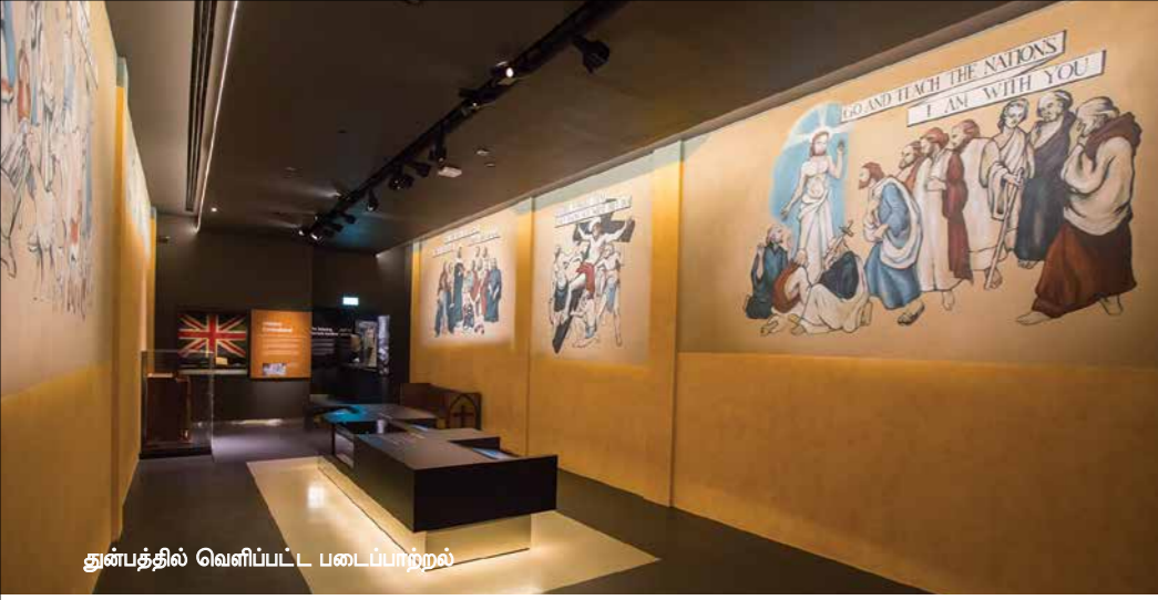
துன்பத்தில் வெளிப்பட்ட படைப்பாற்றல்