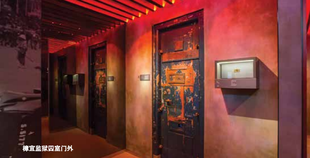
樟宜监狱囚室门外