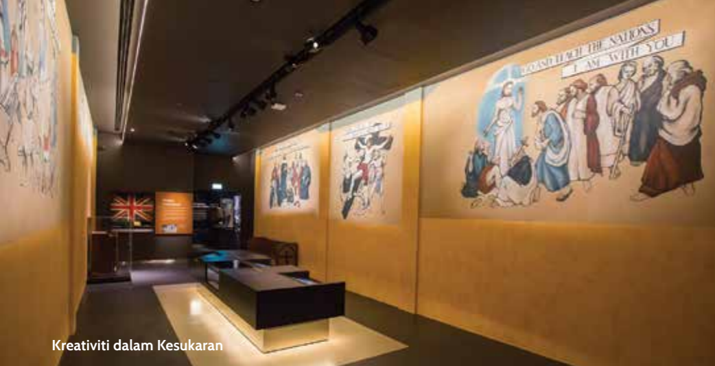
Kreativiti dalam Kesukaran