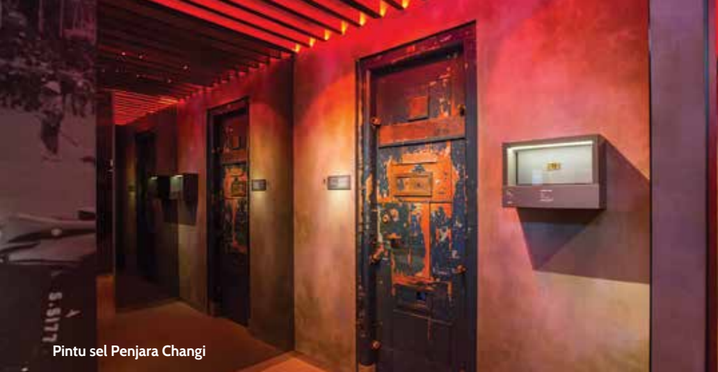
Pintu sel Penjara Changi