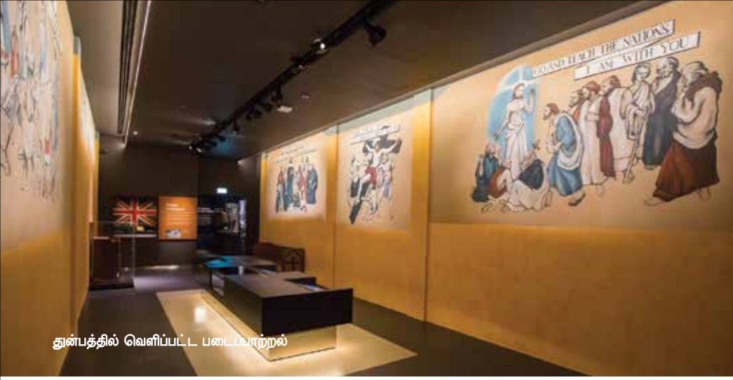
துன்பத்தில் வெளிப்பட்ட படைப்பாற்றல்